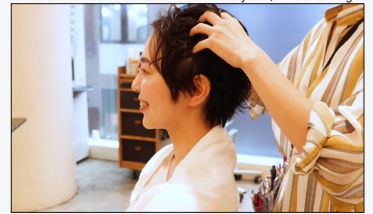
Hair Solyu / Massage