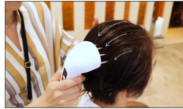
Hair Grow / PremiumAR Essence Uprise